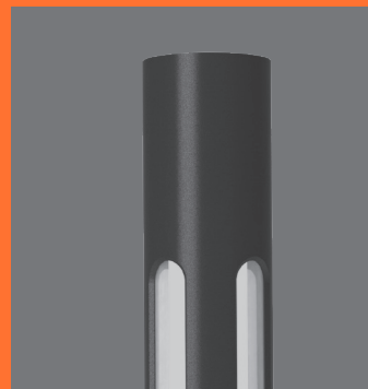
Detajl svetilnega modula.