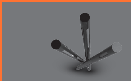
Idejna zasnova kreativne postavitve.