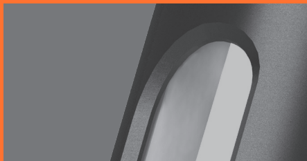
Detajl svetilnega modula.